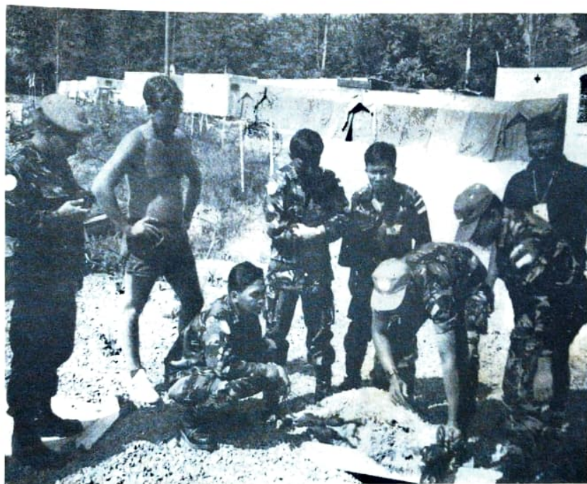
Ikut mendamaikan dunia