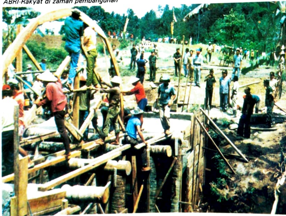
ABRI-Rakyat di zaman pembangunan

Tetapi, walaupun mereka berjasa, kehadirannya menghalangi pembenahan organisasi tentara nasional. Sehingga, pada 5 Mei 1947, Presiden mendirikan Panitia Pembentukan Organisasi