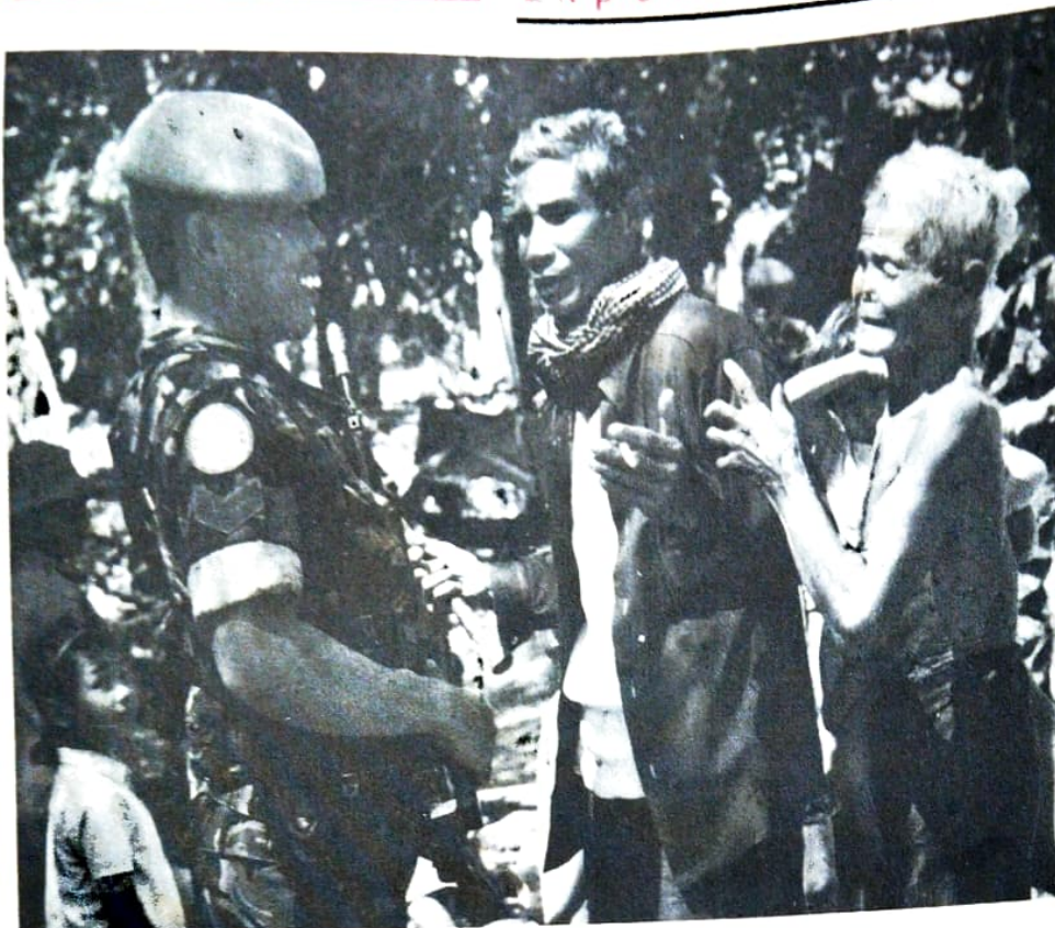
Missi damai di Kamboja

Sudarsono di New Delhi. Kemenangan politik itu membuat PBB segera mendesak Belanda untuk berunding lagi dengan Indonesia. Lahirlah perundingan yang kemudian menghasilkan Perseutujuan Roem-Royen yang terkenal itu, 7 Mei 1949, yang berikutnya membawa kedua negara ke Konferensi Meja Bundar di Den Haag.