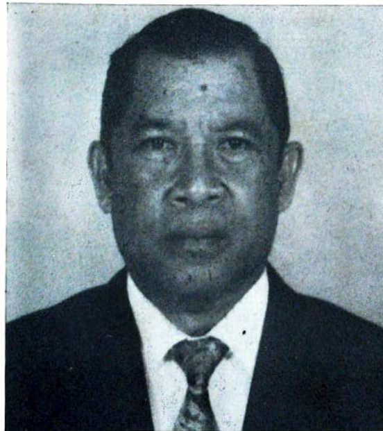
Letjen TNI Suparman Ahmad

F-ABRI sudah diberi program oleh Mabes ABRI, di samping kita meneliti berbagai perkembangan yang muncul. Dan berkonsultasi dengan Mabes ABRI, biasanya dilakukan saat-saat akan reses. Di sana kita mendapat arahan-arahan, tapi