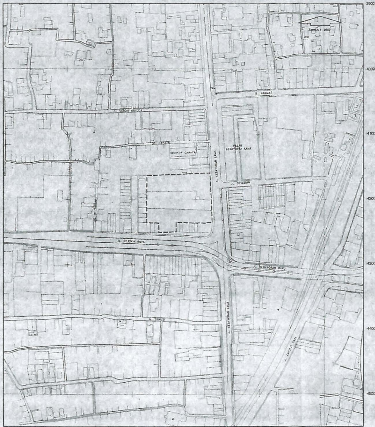
PETA IKHTISAR 1 : 20.000