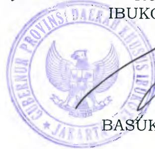
BASUKI T. PURNAMA

✓ GUBERNUR PROVINSI DAERAH KHUSUS IBUKOTA JAKARTA, ✓