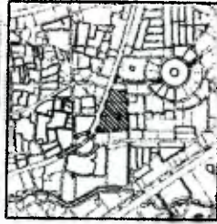
PETA IKHTISAR SKALA : 1:40.000

TANGGAL : 9 MARET TAHUN : 2020 KELURAHAN : KARET KUNINGAN KECAMATAN : SETIABUDI KOTA ADMINISTRASI : JAKARTA SELATAN BLOK : 03 SUB BLOK : 002, 003, 004 SKALA : 1:3.000