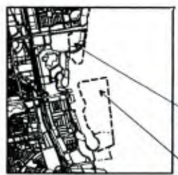
PETA KTHISAR SKALA : 1:100.000