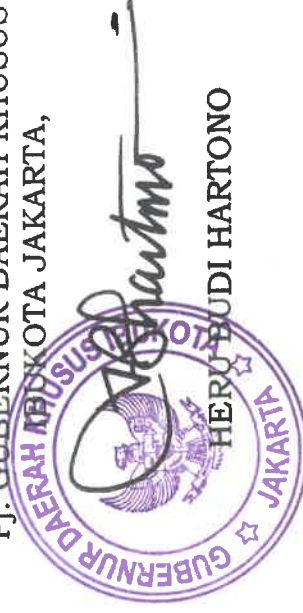
HERU BUDI HARTONO

Pj. GUBERNUR DAERAH KHUSUS IBUKOTA JAKARTA,