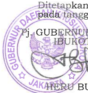
HERU BUDI HARTONO

Pj. GUBERNUR DAERAH KHUSUS IBUKOTA JAKARTA,