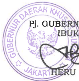
Pj. GUBERNUR DAERAH KHUSUS IBUKOTA JAKARTA,