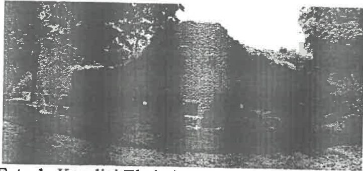
Foto 1. Kondisi Eksisting Tampak Reruntuhan Menara Martello Pulau Bidadari