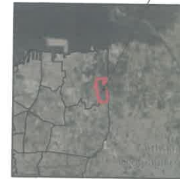
PETA IKTHISAR SKALA : 1:500.000