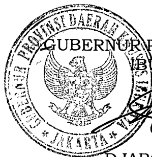
DJAROT SAIFUL HIDAYAT